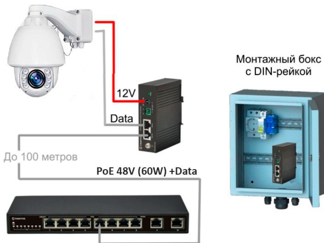
Рисунок 2 - Схема подключения видекамеры с помощью сплиттера

Схема подключения видекамеры RV-3422 с помощью PoE-сплиттера приведена на рисунке 2.